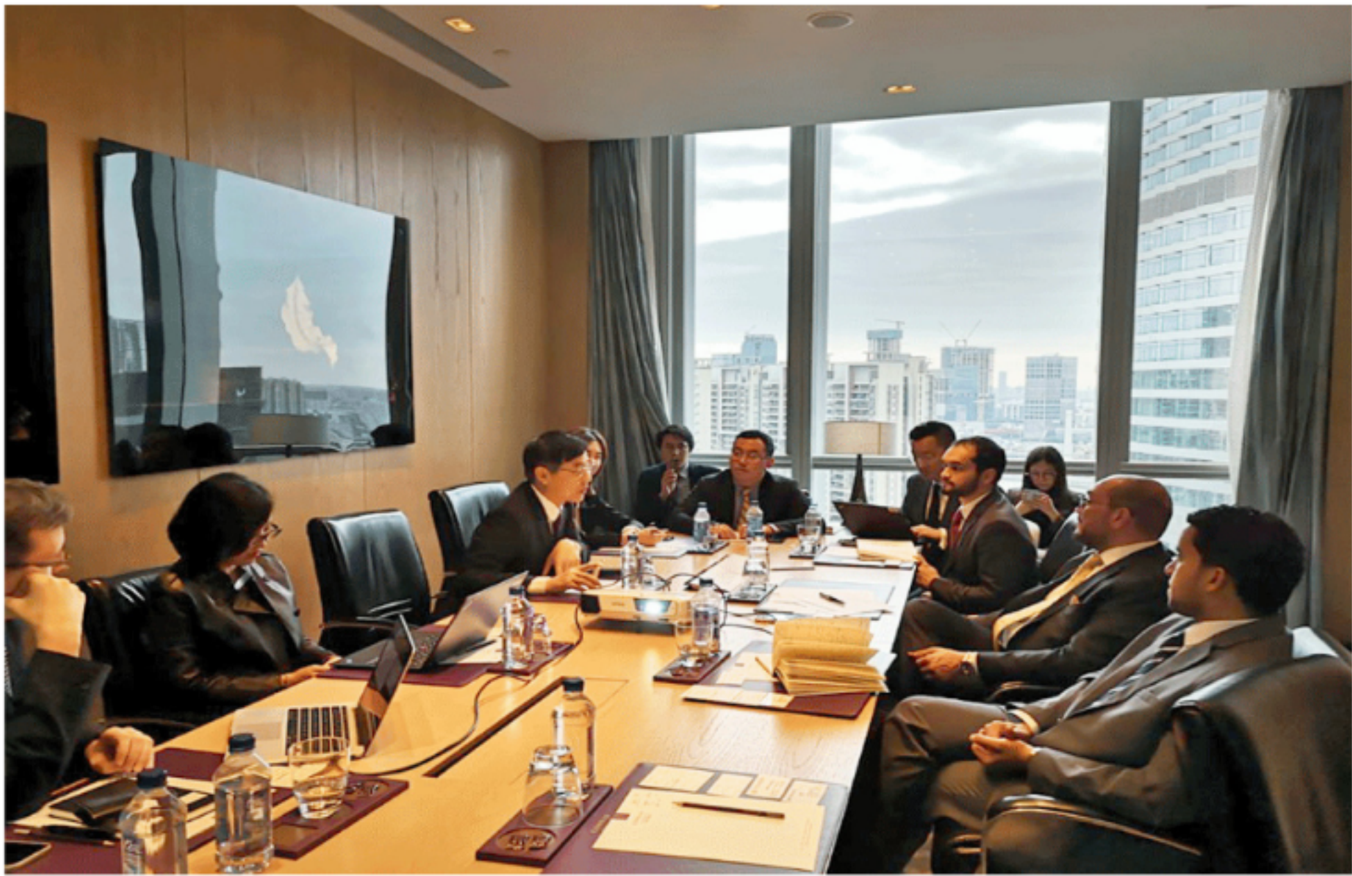
世纪星源总裁与沙特投资总局副局长苏丹·B·穆夫提 (Sultan B. Mofti) 会谈场景

世沙特投资总局副局长苏丹·B·穆夫提副局长全面讲解了沙特投资总局在“沙特 2030”愿景”背景下的工作职责，他表示就该专案项目建立专职沟通渠道，沙特投资总局将积极协助推动世纪星源该专案项目落地。