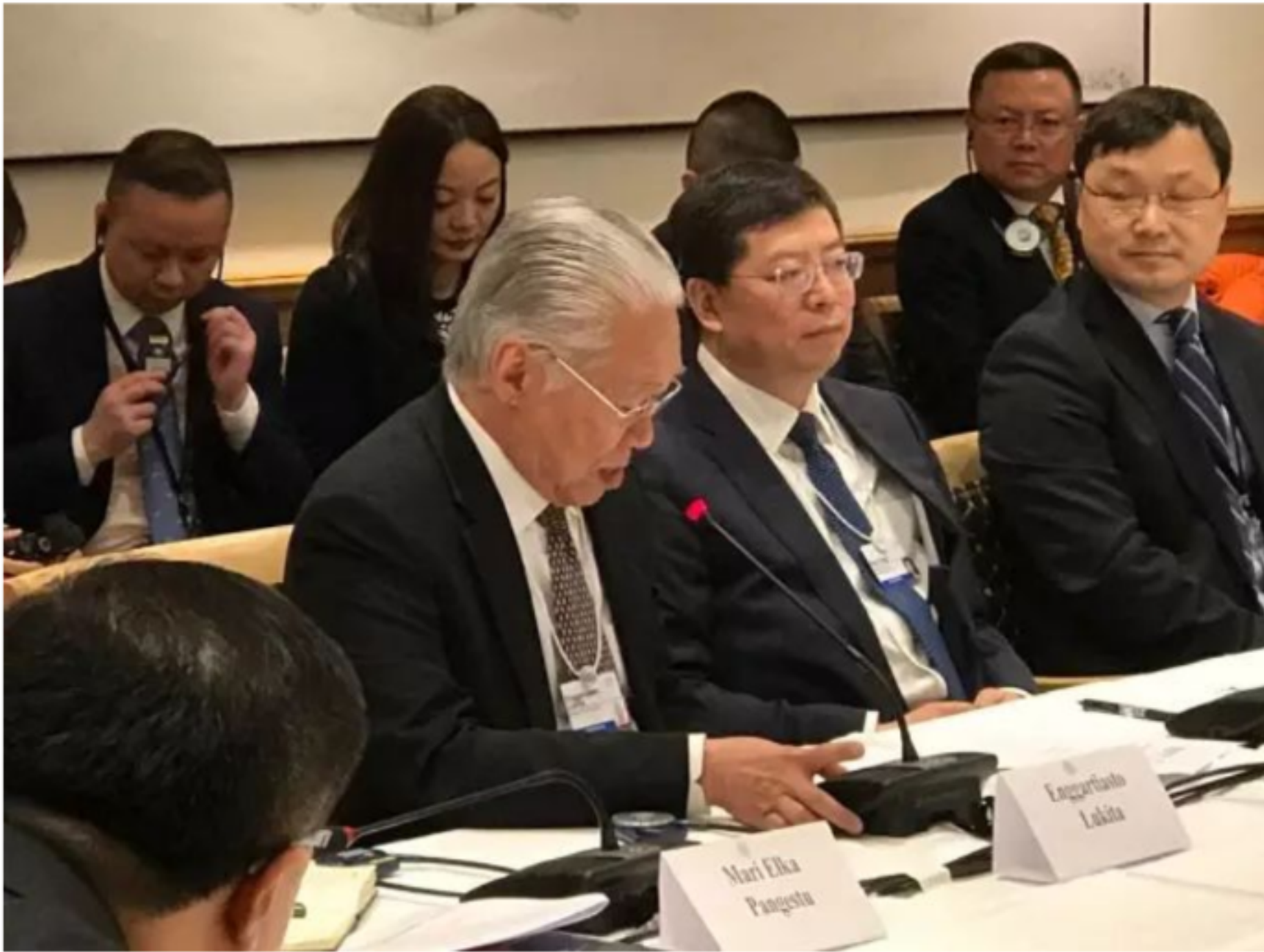
研讨会上印尼贸易部长 Enggartiaso Lukita 发言