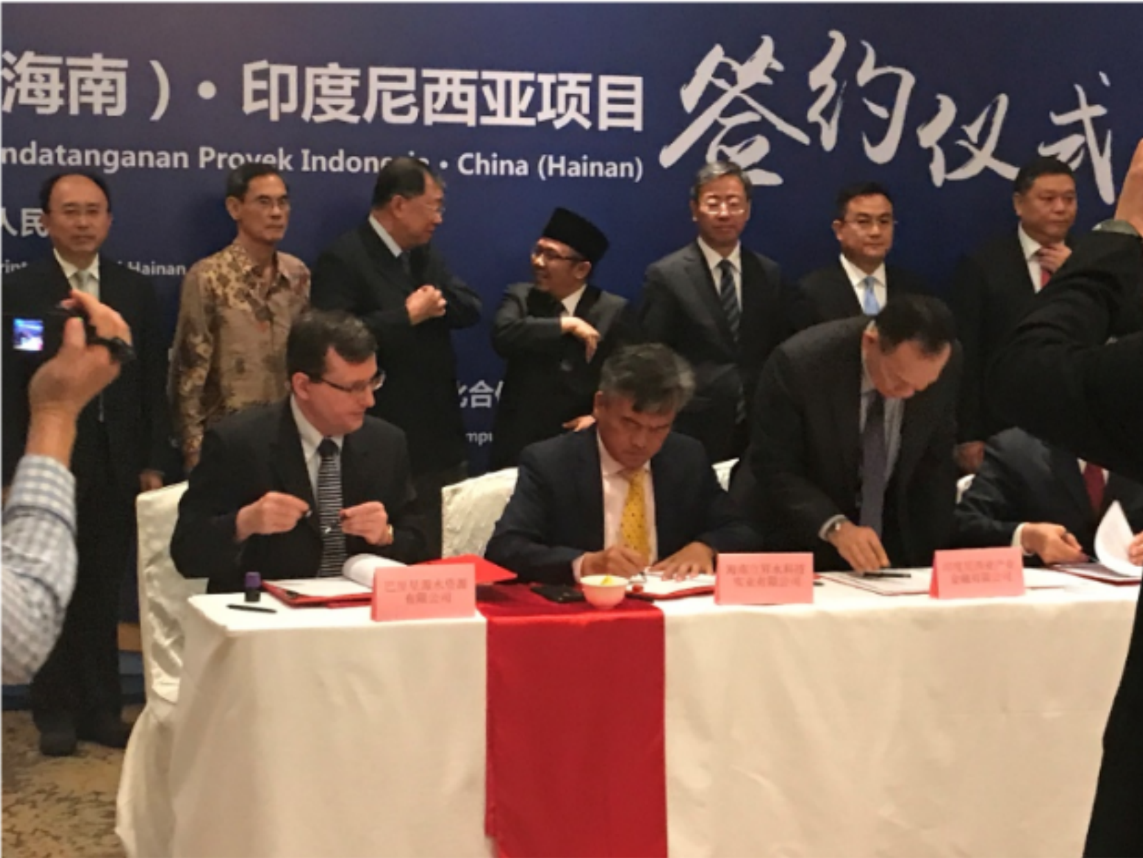
链接 4: 2017 年 7 月 25 日 中国（海南）·印尼项目签约仪式