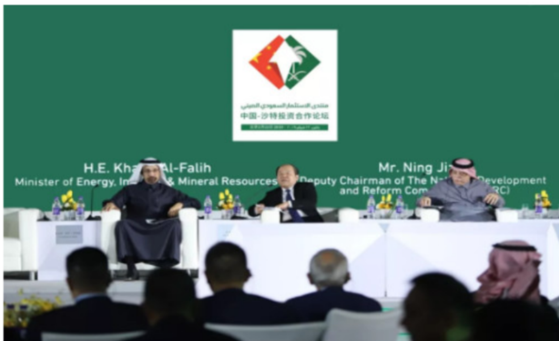
国家发展改革委副主任宁吉喆与沙特能工矿部部长法利赫、沙特商务投资部部长卡萨比进行部长高端对话

2019 年 2 月在沙特王储穆罕默德访华期间，国家发展改革委国际合作中心与沙特投资总局在北京共同举办了“中国-沙特投资合作论坛”。